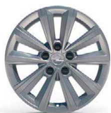
MI19 (pro Edition)