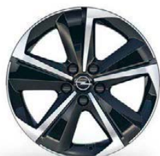
ZHYD/Mi19 (pro GS/Ultimate)